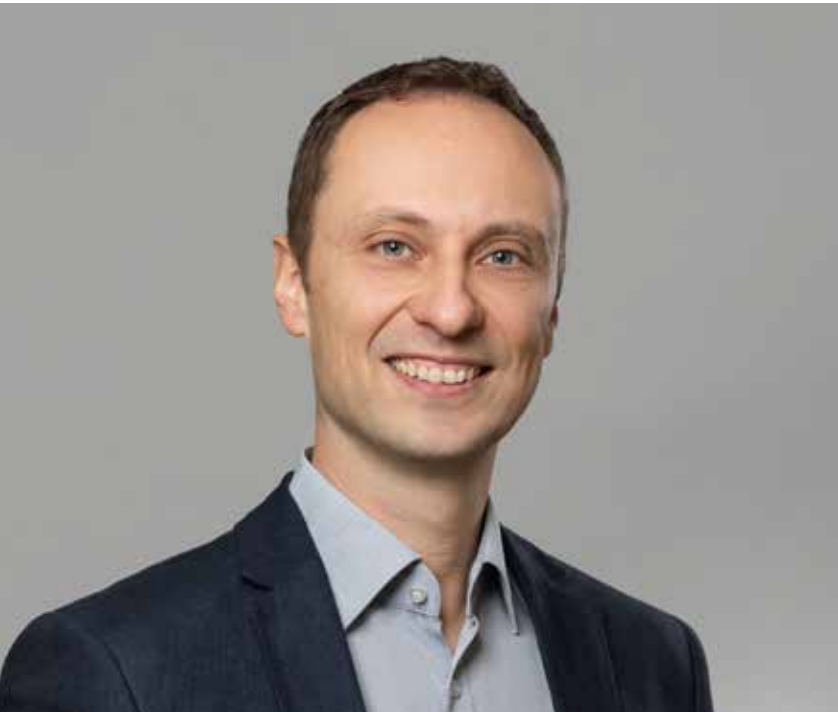
Teamleiter Produktmanagement Independent Aftermarket